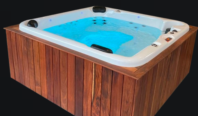
FALDÓN DE LÍNEA