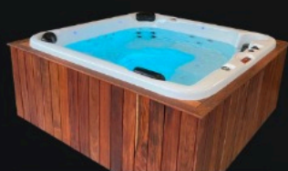
FALDÓN DE LÍNEA